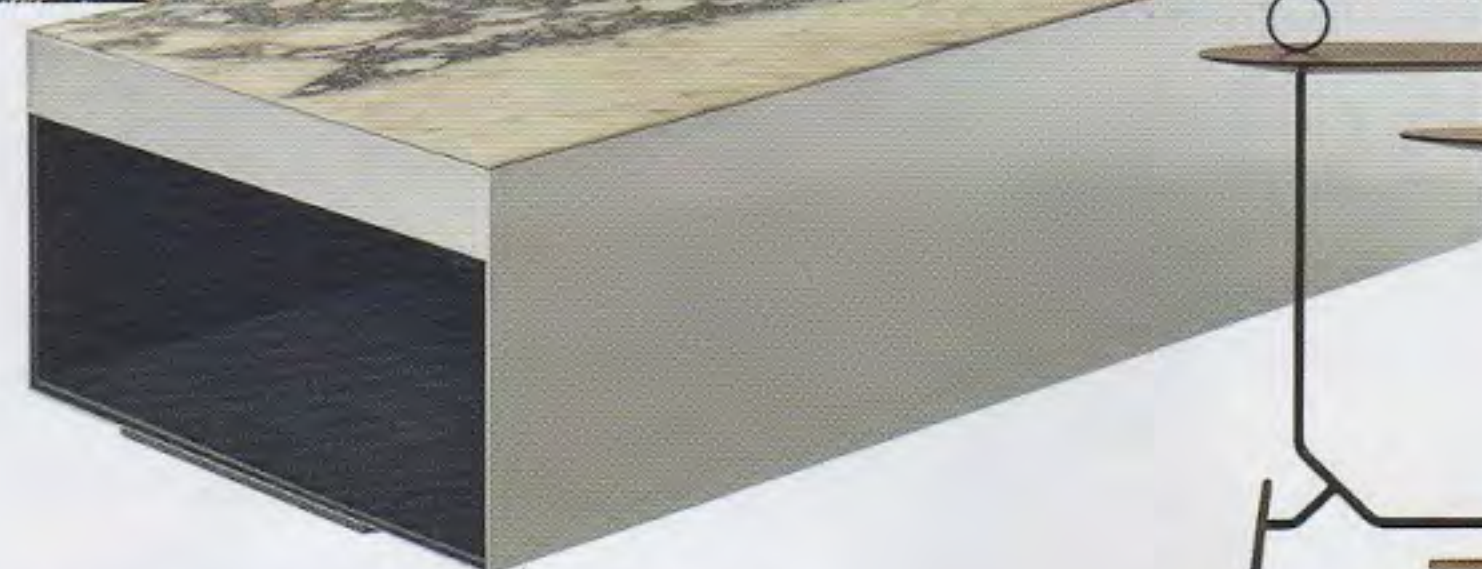
TABLE BASSE à espace de rangement latéral en métal et MDF plaqué chêne, L 80 x l 50 x h 35 cm, design Rodolfo Dordoni, Elliott , à partir de 2 990 €, MINOTTI chez Silvera.